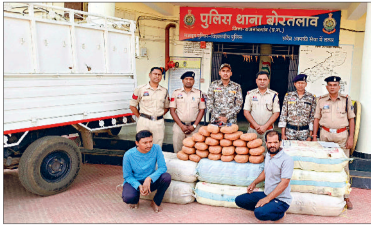
नाकाबंदी पाईट लगा