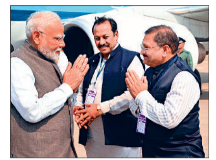
हरिभूमि न्यूज़ ►► राजनांदगांव

प्रधानमंत्री नरेंद्र मोदी का रायपुर एयरपोर्ट आगमन पर राजनांदगांव लोकसभा क्षेत्र सांसद संतोष पांडे एवं दुर्गा लोकसभा क्षेत्र सांसद विजय बघेल ने रायपुर एयरपोर्ट पर प्रधानमंत्री नरेंद्र मोदी का स्वागत सम्मान किया।