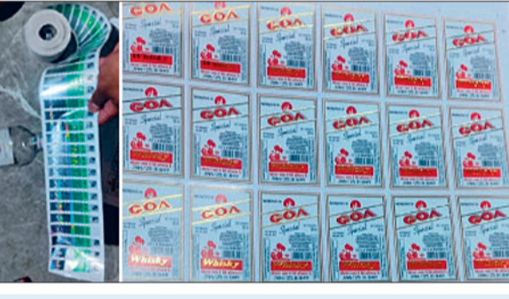
बोतल कबाड़ी से खरीदी : इस पूरे मामले में कबाड़ी दुकान वालों की भी संलिप्तता से इंकार नहीं किया जा सकता है। मिली जानकारी के अनुसार आरोपी द्वारा बाटलिंग के लिए शराब बोतल की व्यवस्था कबाड़ी दुकान के जरिए की जा रही थी। पुलिस इस मामले में अब उस कबाड़ी दुकानदार का भी पता कर रही है, जहां से आरोपी द्वारा लगातार शराब की बोतलें खरीदी जाती थीं।

खिलाफ कार्रवाई की है। हालांकि अब तक इस मामले में किसी भी आरोपी की गिरफ्तारी नहीं हो पाई है। वहीं इस मामले में हर रोज नए खुलासे हो रहे हैं। इनमें ही नया मामला नकली होलोग्राम को लेकर सामने आया है। ज्ञात हो प्रदेश में ईडी पिछली कांग्रेस सरकार के खिलाफ शराब घोटाले में नकली होलोग्राम के चलते ही जांच कर रही है। जिस नकली होलोग्राम का सहाय लेकर प्रदेश में दो हजार करोड़ का शराब घोटाला होना बताया गया, इसी तर्ज पर नकली होलोग्राम के जरिए डोंगरगढ़ में भी शराब बाटलिंग के इस खेल को अंजाम दिया जा रहा था। इधर आबकारी विभाग अब इस मामले में डोंगरगढ़ में पदस्थ अपने स्टाफ को नोटिस जारी करने की तैयारी में है। नोटिस जारी कर उन कर्मचारियों से सवाल-जवाब किए जाएंगे।