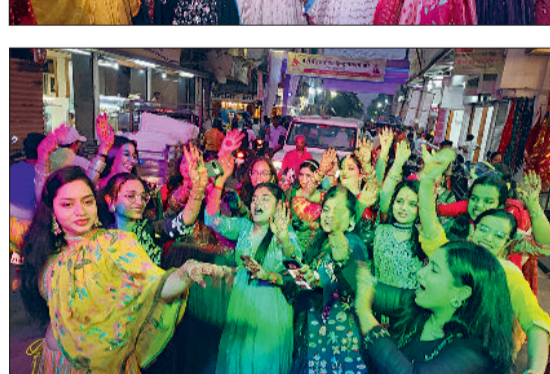
राजनांदगांव। गणगौर पर्व के अवसर पर शहर में जगह-जगह शोभायात्रा निकाली गई जिसमें बड़ी संख्या में सामाजिकगण उपस्थित थे। इस अवसर पर दिन भर श्रद्धा भक्ति का माहौल रहा।