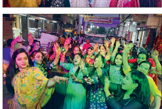
राजनांदगांव। गणगौर पर्व के अवसर पर शहर में जगह-जगह शोभायात्रा निकाली गई जिसमें बड़ी संख्या में सामाजिकगण उपस्थित थे। इस अवसर पर दिन भर श्रद्धा भक्ति का माहौल रहा।